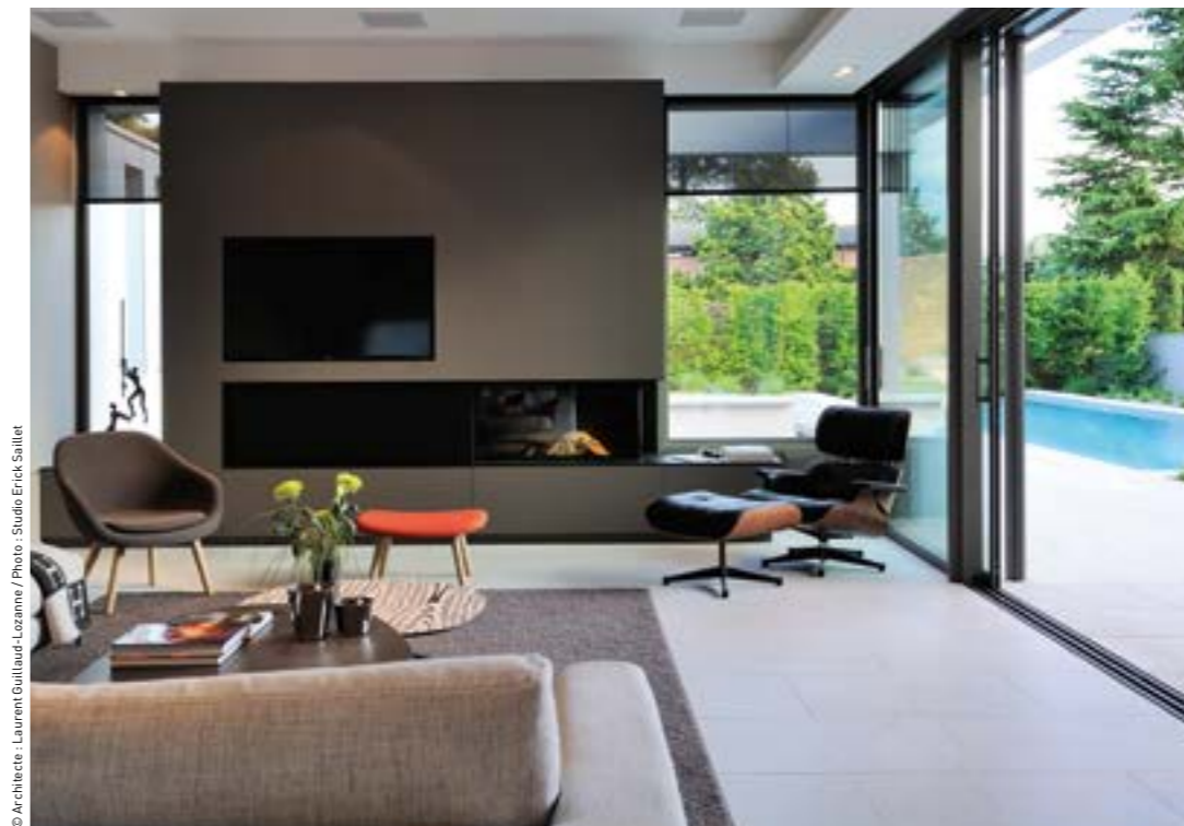
© Architecte Laurent Guillaud-Lozanne

*Porte-fenêtre 1 vantail (L. 1,25 m x H. 1,48 m) T. Vitrage Ug = 0,5+ intercal. isolant **Fenêtre 1 vantail B0 (L. 1,20 m x H. 1,60 m) ***Fenêtre 1 vantail OB (L. 1,23 m x H. 1,48 m) ****Fenêtre et porte-fenêtre OB 1 vantail (L. 1,40 m x H. 1,60 m) Fenêtre italienne (L. 1,40 m x H. 1,60 m)