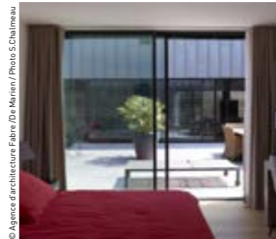
© Agence d'architecture Fabre / De Maenen / Photo S.Chalmeau