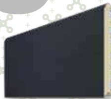
GRIS ANTHRACITE 7016